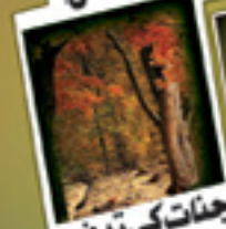
جنات کی تدفین