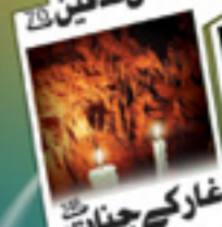
غار کے جنات