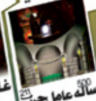
500 سالہ عامل جن