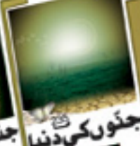
جنات کی دنیا